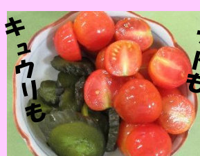
キュウリも トマトも 梅ジャムで