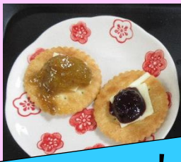
リップパーティー！！