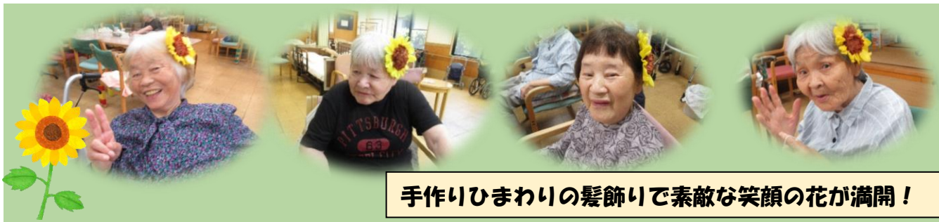
手作りひまわりの髪飾りで素敵な笑顔の花が満開！

朝の空気に爽秋の気配が感じられる頃となりました。まだまだ日中、暑い日が続きますね。コロナも広まり以前の様な交流は減ってしまいました。しかし備後の里では感染予防を徹底し、毎日笑顔で過ごしています。