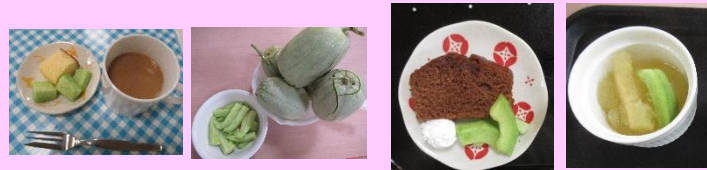
備後の里農園で採れた野菜たちがおいしく変身