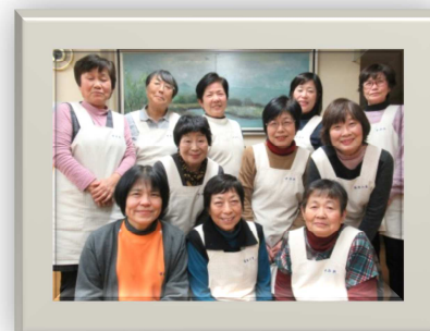
ヘルパーステーションすみれ