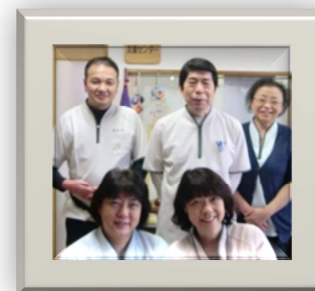
居宅介護支援事業所