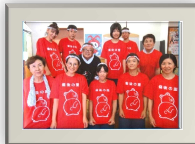
デイサービス備後の里

あけましておめでとうございます。本年は、備後の里 20周年の年となります。開所の翌年より介護保険制度が始まりました。当初は良い制度ができたと思っていました。皆様の初夢はどんな夢でしたか？こどもからお年寄りまで安心して暮らせる社会の実現を正夢にしたいですね。