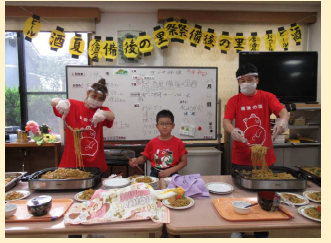
焼きそばおかわりしてくれてありがとー!

祝 ご長寿おめでとうございます。日頃より皆様が健康を維持され備後の里をご利用くださることに感謝申し上げます。ささやかではありますが、9/16~18日は祝賀会を予定しております。