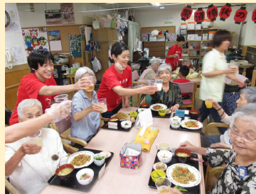
皆さんの健康と備後の里の発展にかんぱーい!!