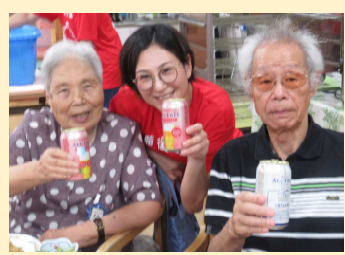
一口目がうまいのよ