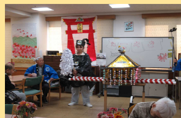
↑少マイチキ臭いやつだな